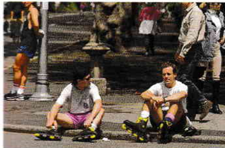
Rolleri odihnindu-se în Central Park

Aveți puțin timp la dispoziție pentru a vizita New Yorkul sau vreți să duceți acasă amintiri de neuitat? Iată topul celor mai inedite experiențe în acest oraș: