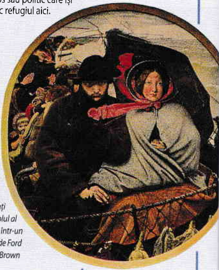
Imigranți din secolul al XIX-lea, într-un tablou de Ford Madox Brown